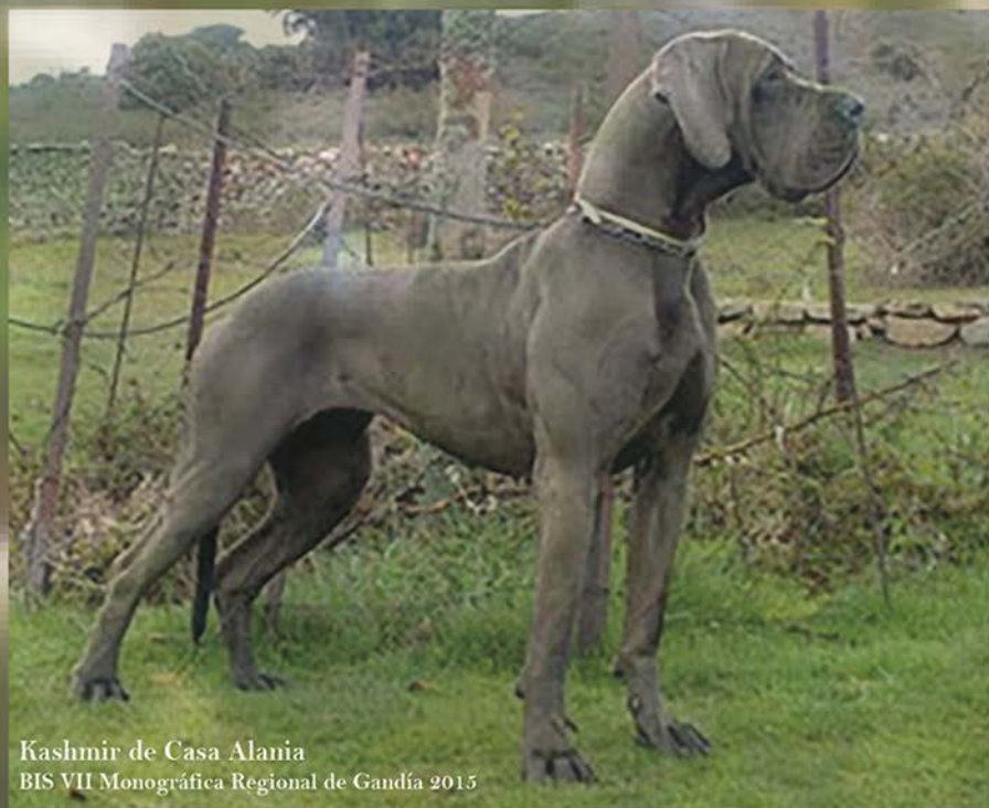
Kashmir de Casa Alania BIS VII Monográfica Regional de Gandía 2015