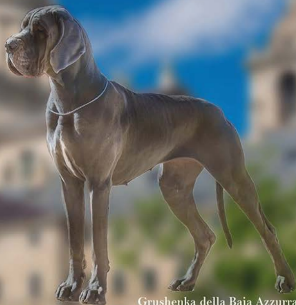
Grushenka della Baia Azzurra BIS XXVIII Monográfica Regional de Madrid 2017