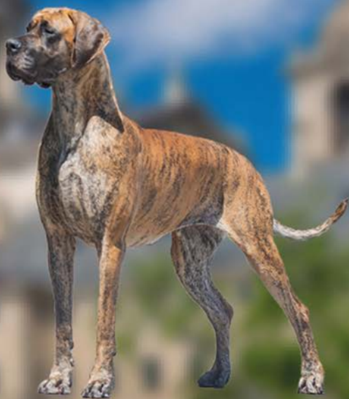
Estefanía de Rosas do Vale BIS XL Monográfica Nacional del CEDDA 2019