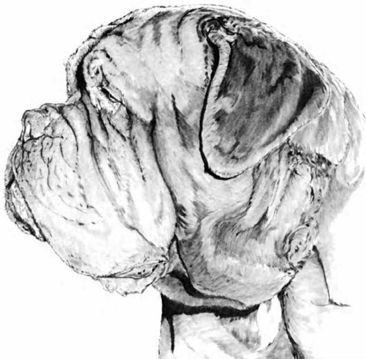
DOGO DE BURDEOS